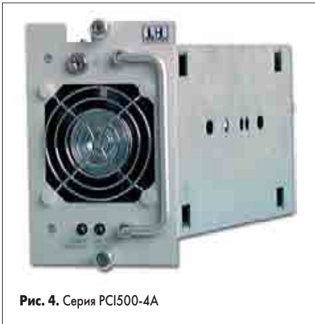
Рис. 4. Серия PCI500-4A

Подобные приборы используются в основном в качестве источников вторичного электропитания. Они представлены следующими сериями: DNX301, DNX350, CPIC350DC, PCI500-4X. Две последние серии предназначены для работы в системах Compact PCI и обеспечивают все необходимые для работы этих систем напряжения.