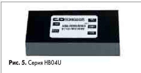
Рис. 5. Серия HB04U

Среди вышеупомянутых конвертеров особо следует отметить такие подгруппы, как конвертеры с высокой изоляцией между входом и выходом (до 8 кВ) — серий NMJ, NMS, HB04U, а также конвертеры для поверхностного монтажа (серии HPR1XX, NTA, NTE, NTV, HL02R), выполненные по технологии производства микросхем (монтаж на рамке), что обеспечивает компланарность выводов ± 0,1 мм.