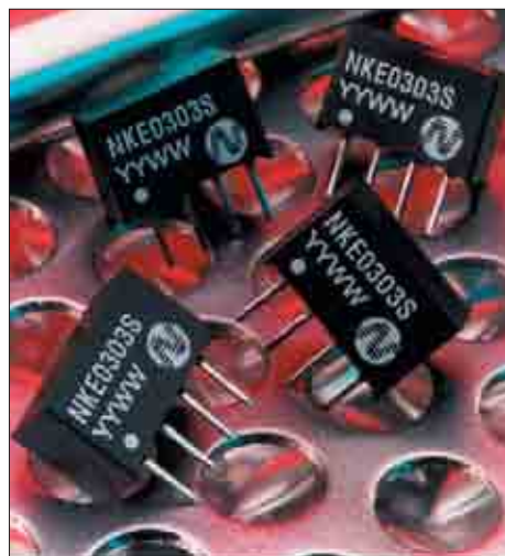
Рис. 1. Серия NKE

Подобные конверторы представлены в основном семействами LME, HPR1XX, HPR4XX,