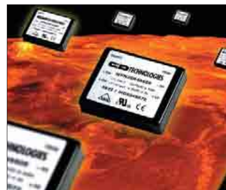
Рис. 3. Серия WPN20R

Эти конверторы представлены следующими семействами: NPH105, WPC10R, NPH15S, WPN20R, NPH25S, VSX40, VKA50, VKA60, VKP60, VSX60, VKA75, VKA100, VKP100, VKA150. Особенностями данных серий являются высокая эффективность (до 89 %), наличие дополнительных опций регулировки частоты и выходного напряжения, опция внешнего отключения. Все конверторы имеют стандартную разводку и большинство из них сертифицировано по стандарту UL1950.