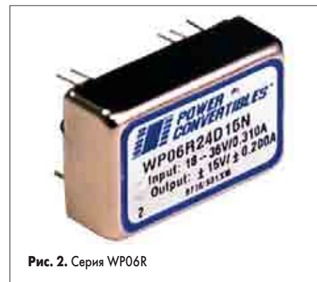
Рис. 2. Серия WP06R

Данные конверторы представлены семействами PWR11XX, PWR13XX, HL02R, NDL, NMH, NML, NMS, NMT, NDY, PWR12XX, HB04U, WP06R. Эти конверторы имеют расположение выводов по общепромышленному стандарту, а также работают в широком диапазоне температур. Кроме того, конверторы снабжены постоянной защитой от перенапряжения и короткого замыкания, а также защитой от перегрева. Некоторые модели обладают опцией удаленного включения-выключения.